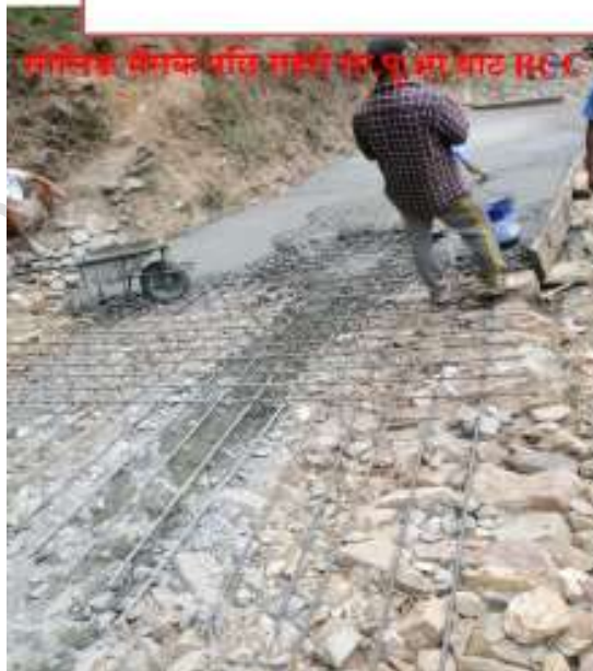
सोलिड बाटोको लागि राखी रहेको भाट सडक